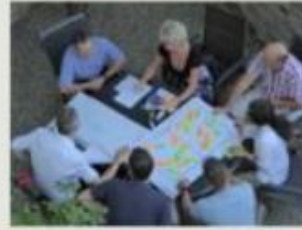
› Workshop zur Ideenfindung